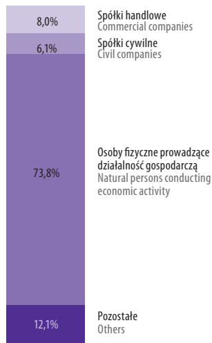
WEDŁUG FORM PRAWNYCH BY LEGAL STATUS