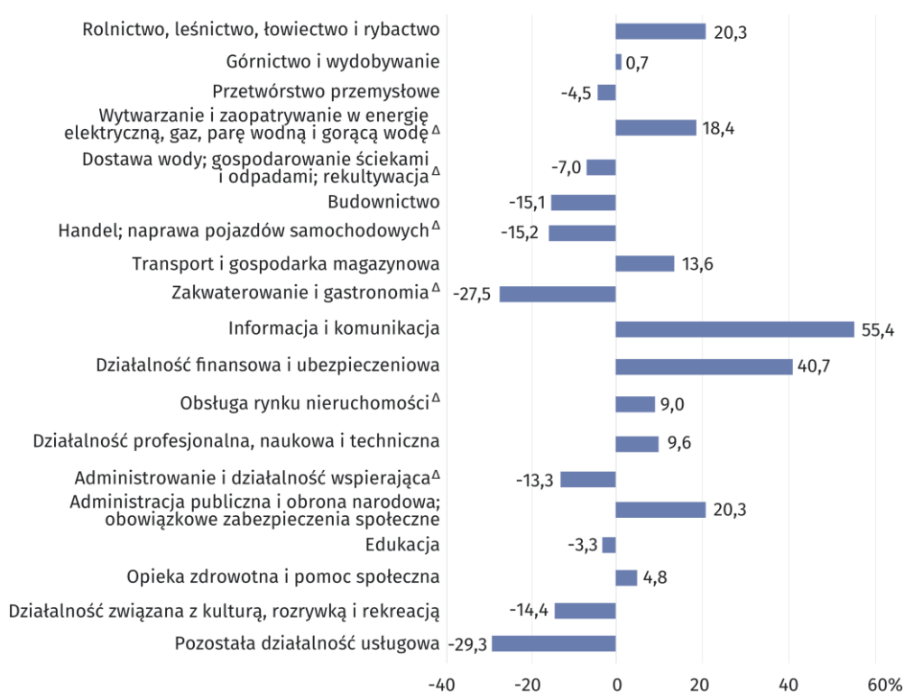
Wykres 2. Odchylenia względne przeciętnych miesięcznych wynagrodzeń brutto w sekcjach od przeciętnego wynagrodzenia w województwie w 2023 r.

Najwyższe przeciętne miesięczne wynagrodzenia brutto odnotowano w sekcjach: Informacja i komunikacja (10 890,08 zł), Działalność finansowa i ubezpieczeniowa (9 859,09 zł), Administracja publiczna i obrona narodowa; obowiązkowe zabezpieczenie społeczne (8 431,88 zł) oraz Rolnictwo, leśnictwo, łowiectwo i rybactwo (8 431,81 zł). Najniżej wynagradzani byli pracownicy z sekcji: Pozostała działalność usługowa (4 952,33 zł) oraz Zakwaterowanie i gastronomia (5 083,66 zł).