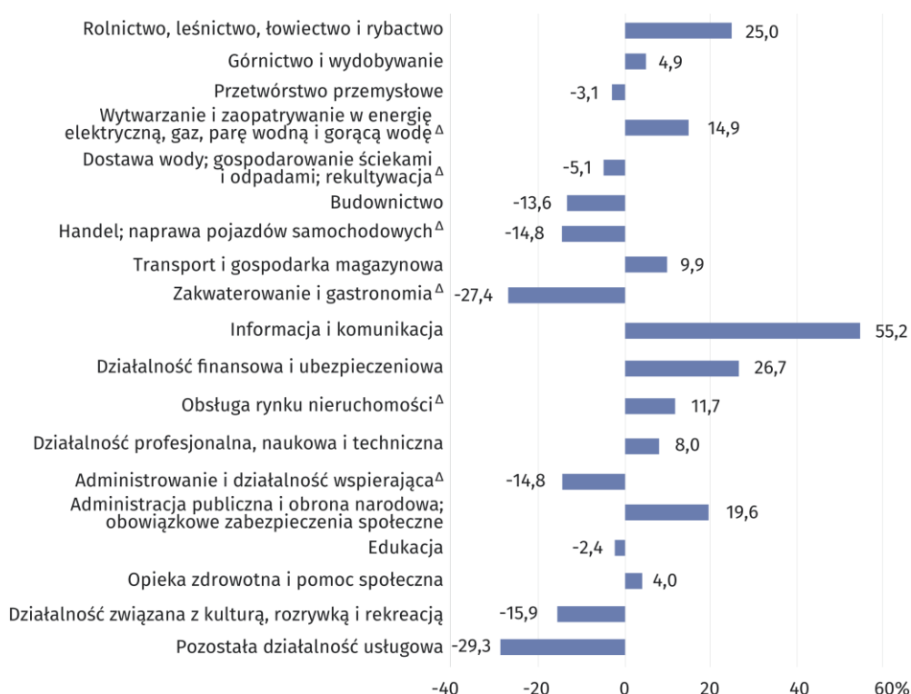
Wykres 2. Odchylenia względne przeciętnych miesięcznych wynagrodzeń brutto w sekcjach od przeciętnego wynagrodzenia w województwie w 2022 r.

Najwyższe przeciętne miesięczne wynagrodzenia brutto odnotowano w sekcjach: Informacja i komunikacja (9573,13 zł), Działalność finansowa i ubezpieczeniowa (7818,53 zł) oraz Rolnictwo, leśnictwo, łowiectwo i rybactwo (7713,47 zł). Najniżej wynagradzani byli pracownicy z sekcji: Pozostała działalność usługowa (4361,91 zł), Zakwaterowanie i gastronomia (4476,82 zł) oraz Działalność związana z kulturą, rozrywką i rekreacją (5187,54 zł).